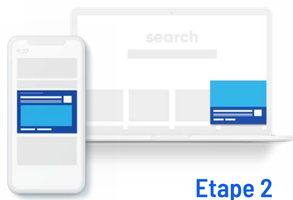
Etape 2 Réception

L'internaute reçoit une demande d'autorisation des notifications sur l'un de nos supports partenaires.