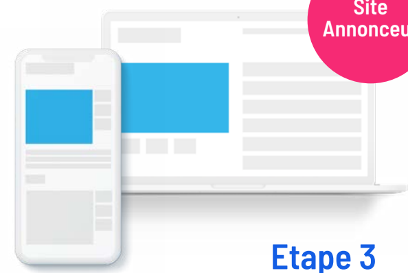
Etape 3 Redirection

L'internaute peut désormais recevoir des notifications directement sur son mobile ou ordinateur.