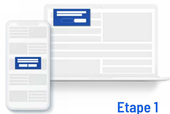
Etape 1 Autorisation

L'internaute reçoit une demande d'autorisation des notifications sur l'un de nos supports partenaires.